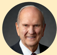
Av president Russell M. Nelson