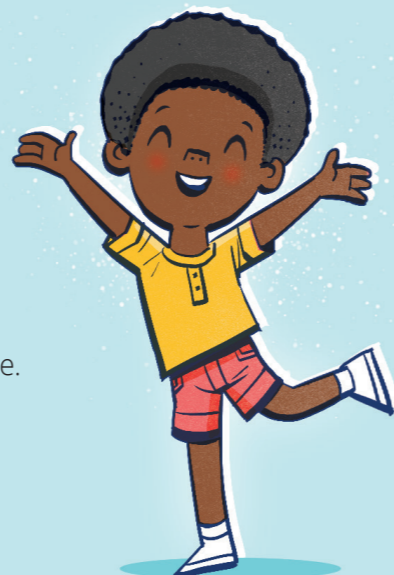
Hjelpe deg å holde deg fri for skadelige vaner.