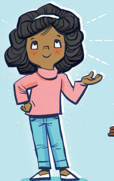
Velsigne deg med lys og glede.

Du er et Guds barn. Gud gir oss bud for å velsigne oss og gi oss glede. Noen ganger velger folk hvilke bud de vil holde og hvilke de ikke vil holde. Å prøve å adlyde alle Guds bud vil: