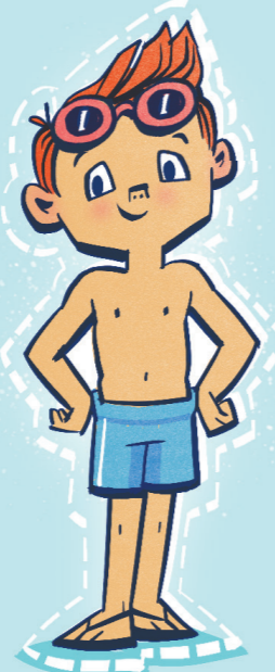
Beskytte kroppen din.