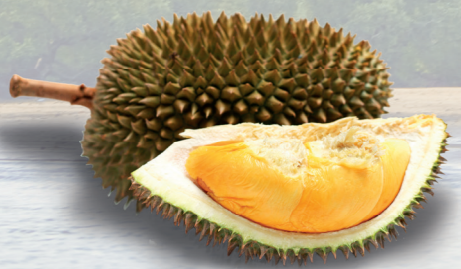
Durian er verdens sterkest duftende frukt! Mange i Malaysia elsker denne kremete frukten. Den brukes til å lage godteri, iskrem og andre godsaker.