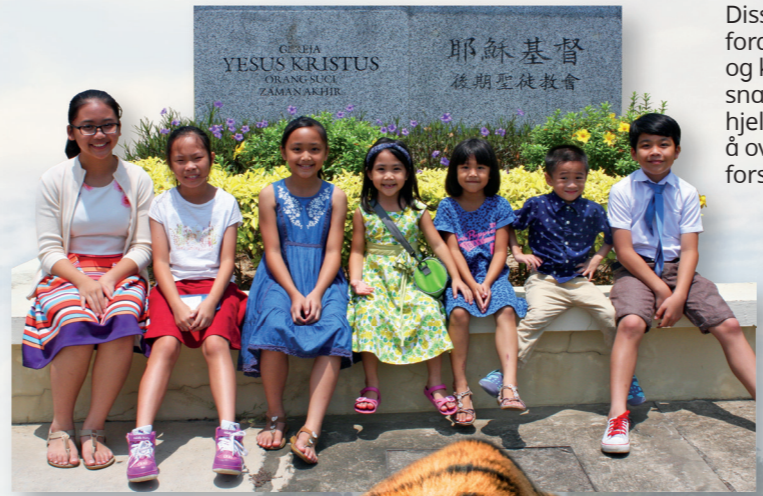
Disse Primær-barna sitter foran et kirkeskilt på malaysisk og kinesisk. Folk i Malaysia snakker mange språk. I kirken hjelper medlemmene til med å oversette slik at alle kan forstå.

Malaysia er et vakkert land i Sørøst-Asia. Det er ca. 10 000 medlemmer av Kirken og 33 grener i Malaysia. Kirken der er liten, men sterk!