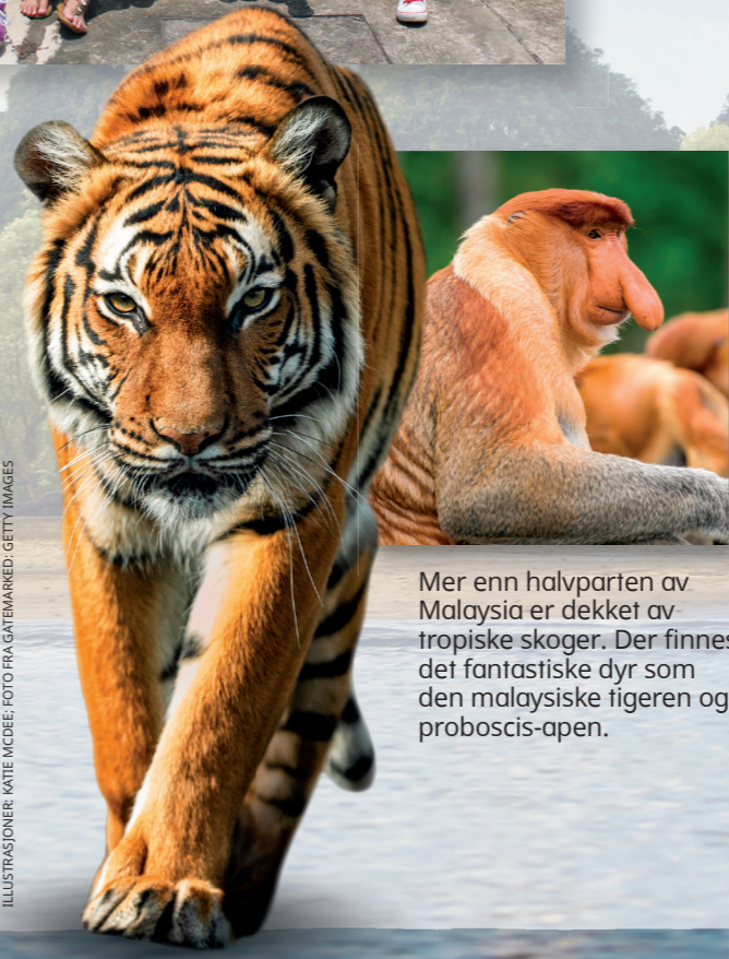
Mer enn halvparten av Malaysia er dekket av tropiske skoger. Der finnes det fantastiske dyr som den malaysiske tigreren og proboscis-åpen.