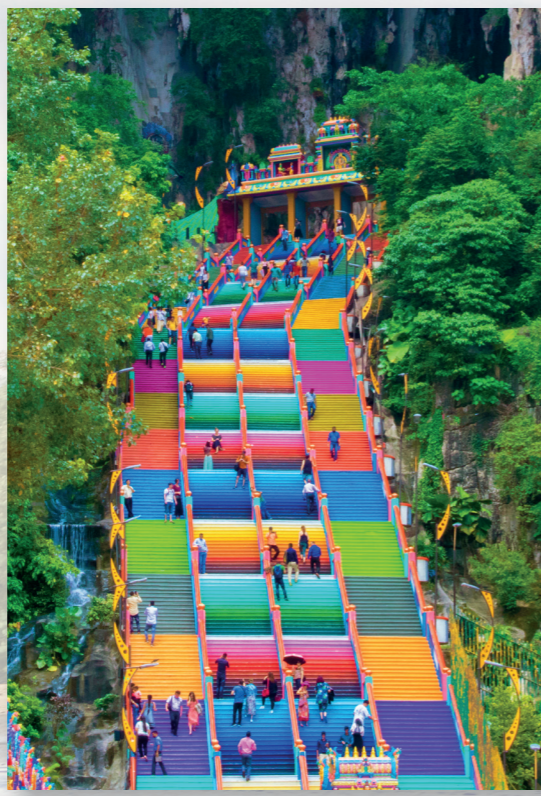
I Malaysia tror folk på mange forskjellige religioner, blant annet islam, buddhismen og kristendommen. Denne fargerike trappen går opp til Batu-grottene. Der er det et kjent hinduistisk tempel!