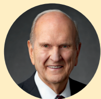
President Russell M. Nelson