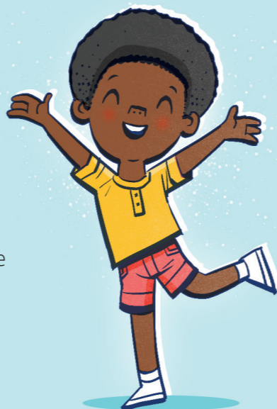
hålla dig fri från skadliga vanor