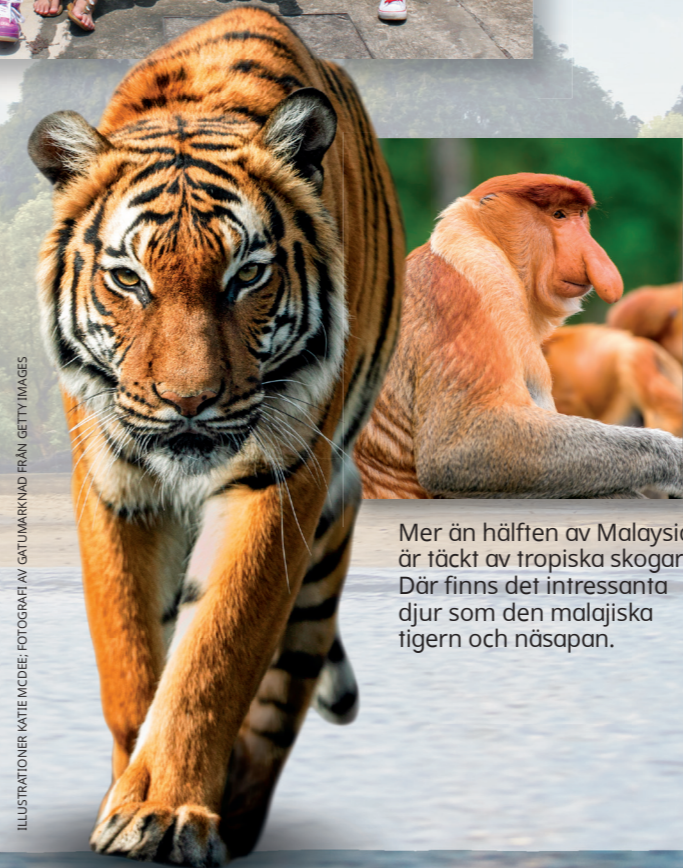
Mer än hälften av Malaysia är täckt av tropiska skogar. Där finns det intressanta djur som den malajiska tigern och näsapan.