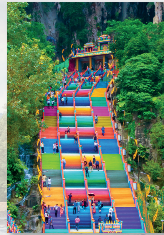
I Malaysia tror folket på många olika religioner, bland annat islam, buddism och kristendom. De här färgglada trapporna leder upp till Batugrotterna. Det finns ett känt hinduiskt tempel därinne!