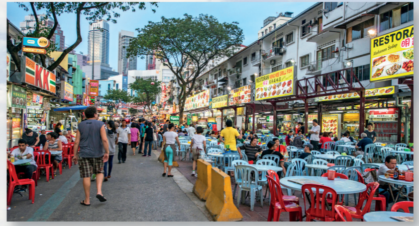
Familjerna i Malaysia tycker om att gå ut och äta tillsammans. Det går att köpa maträtter som säljs utomhus dygnet runt.