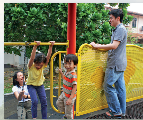
Keluarga betyder "familj" på malajiska. Den här familjen tycker om att leka tillsammans i parken.

Malaysia är ett vackert land i Sydostasien. Det finns omkring 10 000 medlemmar i kyrkan och 33 grenar i Malaysia. Kyrkan där är liten men stark!