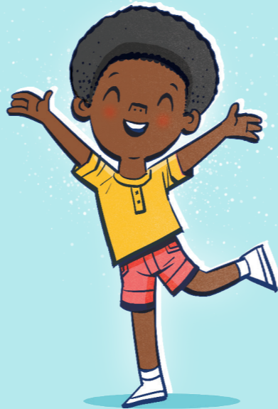
幫助你 免於有害的習慣。