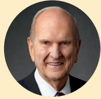
โดย ประธาน รัสเซลล์ เอ็ม. เนลสัน