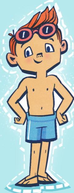
Poprotektahan ang iyong katawan.