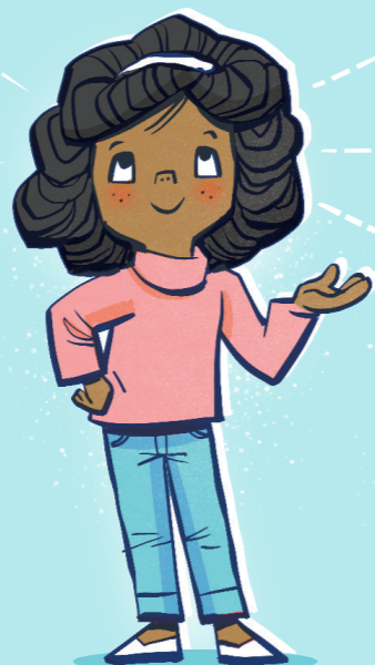
Bibiyayaan ka ng liwanag at galak.

Ikaw ay anak ng Diyos. Bini-bigyan tayo ng Diyos ng mga kautusan para pagpalain tayo at dulutan ng galak. Kung minsan pinipili ng mga tao kung aling mga utos ang susundin nila at kung alin ang hindi. Ang pagsisikap na sundin ang lahat ng utos ng Diyos ay: