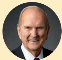
Ni Pangulong Russell M. Nelson