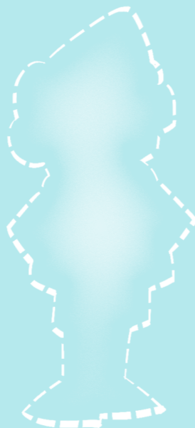
Poprotektahan ang iyong espiritu.

Tandaan, laging nariyan ang Diyos at ang Kanyang mga anghel para tulungan ka. ●