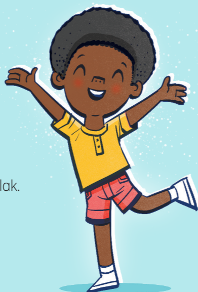
Tutulungan kang lumaya sa nakapipinsalang mga gawi.