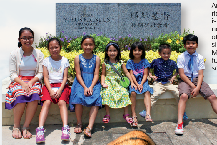
Ang mga batang Primary na ito ay nakaupo sa harap ng isang karatula ng Simbahan na nakasulat sa wikang Malay at Chinese. Maraming wikang sinasalita ang mga tao sa Malaysia. Sa simbahan, tumutulong ang mga miyembro sa pagsalin ng wika para makaunawa ang lahat.