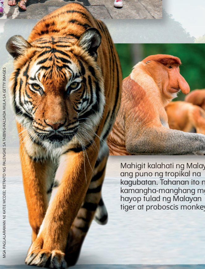
Mahigit kalahati ng Malaysia ang puno ng tropikal na kagubatan. Tahanan ito ng kamangha-manghang mga hayop tulad ng Malayan tiger at proboscis monkey.