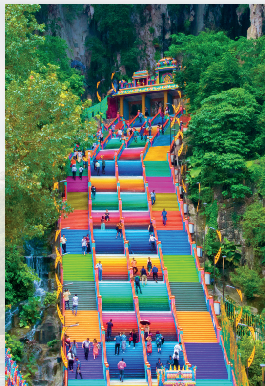
Sa Malaysia, naniniwala ang mga tao sa maraming iba't ibang relihiyon kabilang na ang Islam, Buddhism, at Kristiyanismo. Ang makulay na hagdagang ito ay patungo sa Batu Caves. Isang bantog na Hindu temple ang nasa loob!