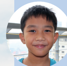
Ang paborito kong saligan ng pananampalataya ay ang ika-apat: "Naniniwala kami na ang mga pangunahing alituntunin at ordenansa ng Ebanghelyo sa Panginoong Jesucristo; pangalawa, Pagsisisi; pangatlo, Pagbibinyag sa pamamagitan ng paglulubog para sa kapatawaran ng mga kasalanan; pang-apat, Pagpapatong ng mga kamay para sa kaloob na Espiritu Santo."