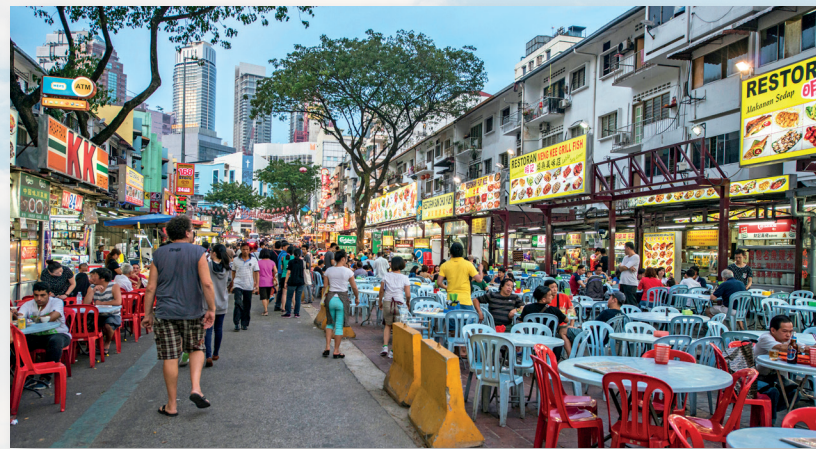
Mahilig lumabas ang mga pamilya sa Malaysia para sama-samang kumain. Nakakabili ang mga tao ng mga pagkain sa tabing-kalsada sa buong maghapon at magdamag.