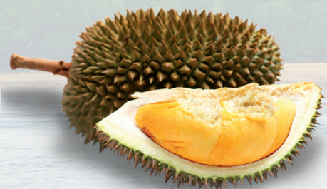
Durian ang prutas na may pinakamatapang na amoy sa mundo! Maraming tao sa Malaysia na mahilig sa makatas na prutas na ito. Ginagamit ito sa paggawa ng kendi, ice cream, at iba pang pagkain.