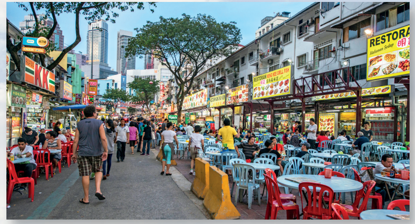
'Oku sai'ia 'a e ngaahi fāmili 'i Malēsia ke nau 'eve'eva 'o kai fakataha. 'Oku lava 'e he kakai 'o fakatau mai 'a e me'akai mei he ve'ehalá he 'ahó mo e poó kakato.