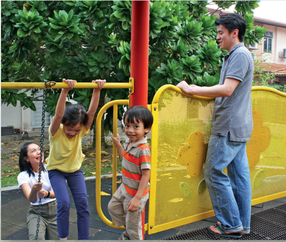
'Oku 'uHINGA 'a e keluarga ki he "fāmili" 'i he lea faka-Maleí. 'Oku sai'ia 'a e fāmili ko 'ení ke nau va'inga fakataha 'i he pāká.

Ko Malēsia ko ha fonua faka'ofa'ofa ia 'i he Tonga-hihifo 'o 'Ēsia. 'Oku 'i ai ha kāingalotu 'o e Siasí 'e toko 10,000 nai mo e ngaahi kolo 'e 33 'i Malēsia. 'Oku toko si'i ka 'oku mālohi 'a e Siasí 'i ai!