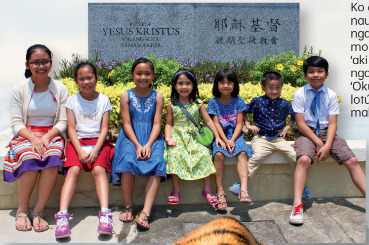
Ko e fānau Palaimeli ko 'ení 'oku nau tangutu 'i mu'a 'i ha faka'ilonga 'a e Siasí 'i he lea faka-Maleí mo e lea faka-Siainá. 'Oku lea 'aki 'e he kakai 'i Malēsia ha ngaahi lea fakafonua kehekehe. 'Oku tokoni 'a e kāingalotú 'i he lotú ke fakatonu lea kae lava ke mahino ki he tokotaha kotoa pē.