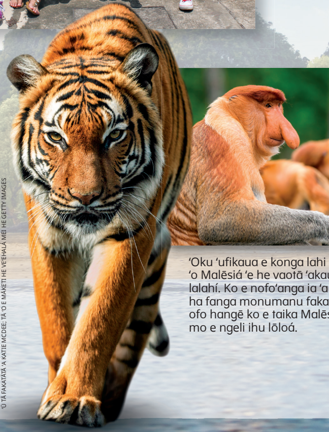
'Oku 'ufikaua e konga lahi 'o Malēsia 'e he vaotá 'akau lalahí. Ko e nofo'anga ia 'a ha fanga monumanu fakaofo hangē ko e taika Malēsia mo e ngeli ihu lōlōá.