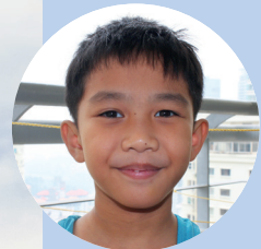
Ko e tefito 'o e tui hono faá 'oku ou manako taha ai: "Oku mau tui ko e ngaahi 'uluaki tefito'í mo'oni mo e ngaahi ouau 'o e Ongoongoleléi ko e: 'uluaki, Tui ki he 'Eiki ko Sísū Kalaisí; uá: Fakatomala; tolú, Papitaiso 'i he fakauku ke fakamolemele'í 'a e ngaahi angahalá; faá, Hilifaki 'o e nima ke ma'u 'a e me'a-foaki 'o e Laumālie Mā'oni'oni."