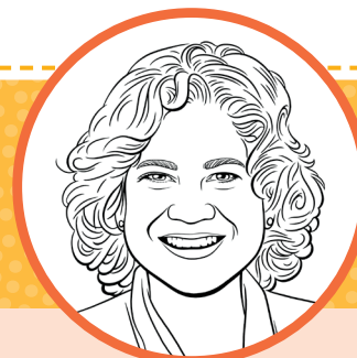
Syster Reyna I. Aburto andra rådgivare i Hjälpföreningens generalpresidentskap