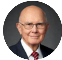
Dallin H. Oaks Premier conseiller dans la Première Présidence