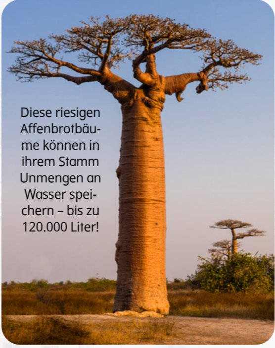
Diese riesigen Affenbrotbäume können in ihrem Stamm Unmengen an Wasser speichern – bis zu 120.000 Liter!