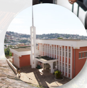
Die Kirche ist in Madagaskar klein, aber sie wächst! Im Moment gibt es 14 Gemeinden und 26 Zweige.