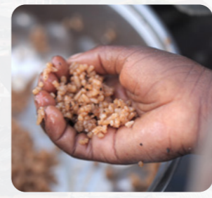
Auf Madagaskar essen viele Menschen zwei bis drei Mal am Tag Reis, manchmal mit Gemüse, Bohnen oder Fleisch.