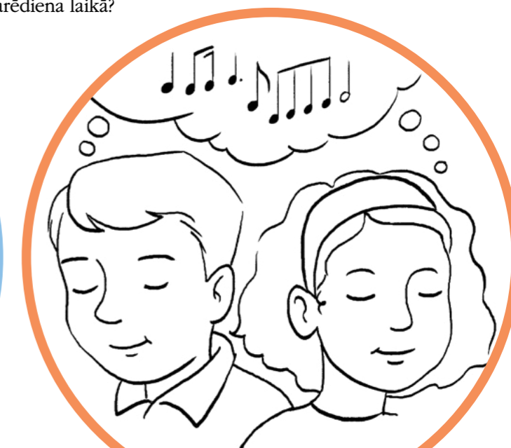
Domāju par savu iemīļotāko Svētā Vakarēdiena dziesmu.