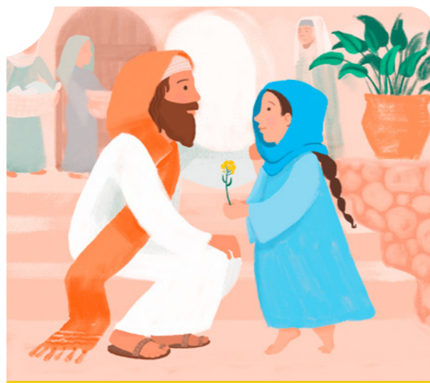
Domājam par Jēzu un apsolām vienmēr Viņu atcerēties.

Svētā Vakarēdiena pieņemšana palīdz mums sajust Svēto Garu. Tā palīdz mums palikt uz ceļa, lai atgrieztos savās debesu mājās. ●