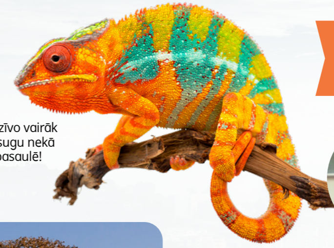
Madagaskarā dzīvo vairāk hameleonu pasugu nekā jebkur citur pasaulē!