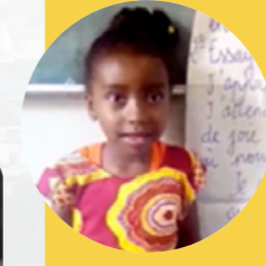
Rasels M. Nelsons ir Dieva pravielis.