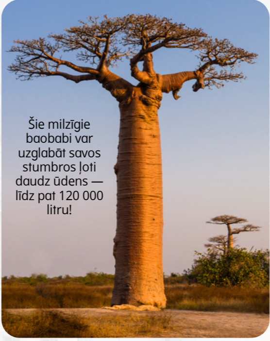
Šie milzīgie baobabi var uzglabāt savos stumbros ļoti daudz ūdens — līdz pat 120 000 litriem!