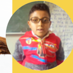
Es zinu, ka Jēzus Kristus ir mūsu Glābējs.