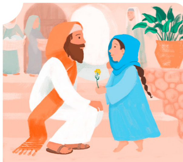
Myślimy o Jezusie i obiecujemy zawsze o Nim pamiętać.