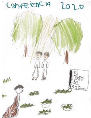
ไอล์ซี เอ็น. อายุ 5 ขวบ, นวยโวลออน เม็กซิโก