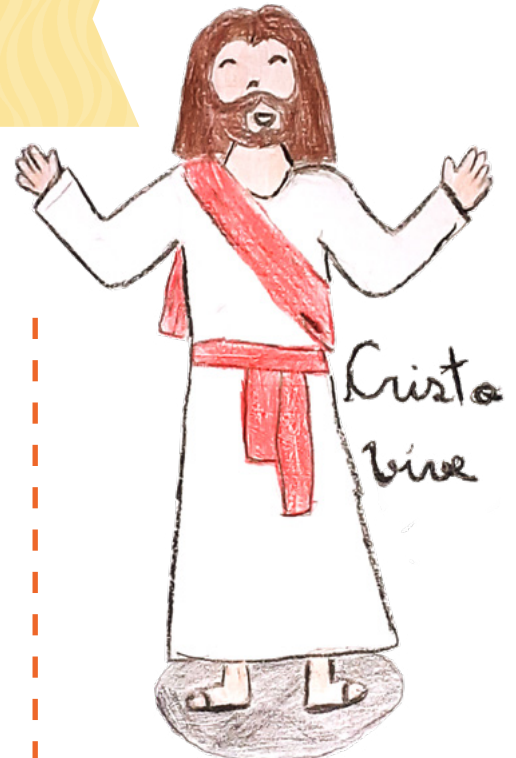
กาเบรียล เอฟ. อายุ 10 ขวบ, มีนัสเจอร์เรียส บราซิล