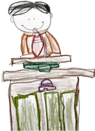
อิสระเบลลา บี. อายุ 5 ขวบ, กัวเตมาลา กัวเตมาลา

การประชุมใหญ่สามัญคือเดือนนี้! ต่อไปนี้เป็นสิ่งที่เด็กบาง คนชื่นชอบเกี่ยวกับการประชุมใหญ่