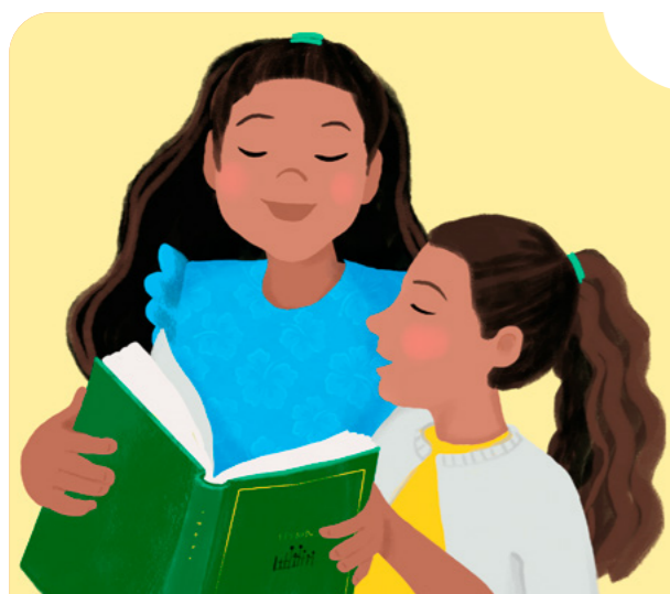
Hát bài thánh ca Tiệc Thánh.