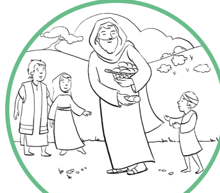
Nafikiria juu ya hadithi kuhusu Yesu.