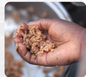
A mwaiti aomata i Madagascar aika a kana te raiti uoua ke teniua te tai n te bongina, n tabetai ma uanikai, biin, ke iriko.

Nomena, ana ririki 6, Antananarivo Province, Madagascar