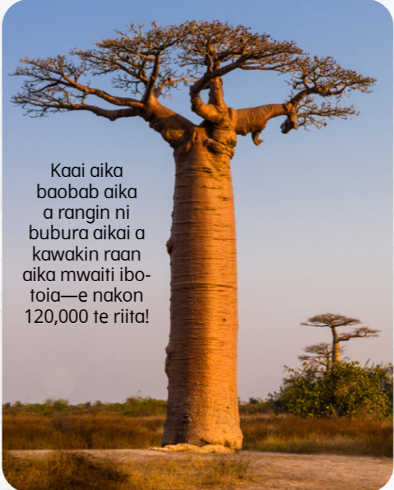
Kaai aika baobab aika a rangin ni bubura aikai a kawakin raan aika mwaiti ibotoia—e nakon 120,000 te riita!