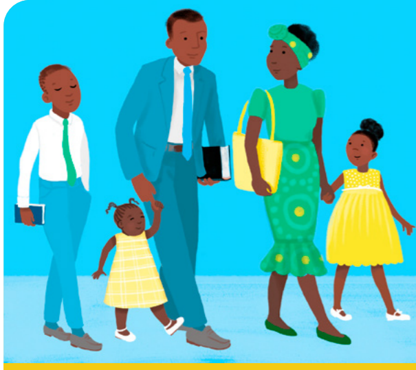
Fai o tatou lavalava e faalia ai tatou te faamamaluina le faamanatuga.