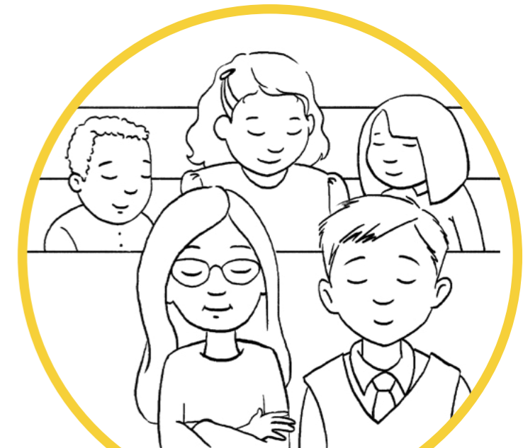
Tatalo i le Tama Faalelagi.

E fesoasoani le faamanatuga ia i tatou ia lagonaina le Agaga Paia. E fesoasoani tatou te tutumau i luga o le ala e toe foi atu ai i lo tatou aiga faalelagi. ●