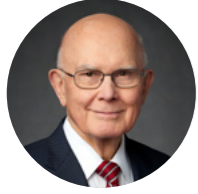
Saunia e Peresitene Dallin H. Oaks Fesoasoani Muamua i le Au Peresitene Sili