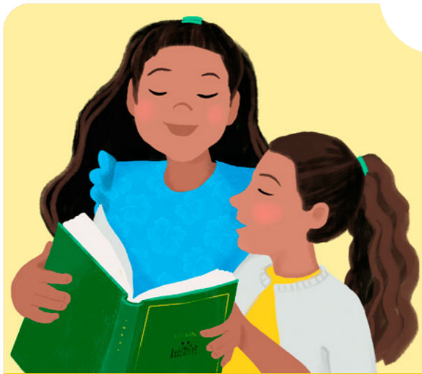
Usu viiga o le faamanatuga.