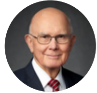
Ni Pangulong Dallin H. Oaks Unang Tagapayo sa Unang Panguluhan