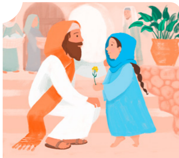
Nag-iisip tungkol kay Jesus at nangangakong palagi Siyang aalalahanin.