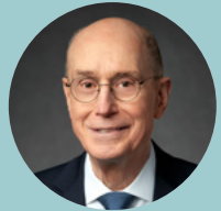
Präsident Henry B. Eyring Zweiter Ratgeber in der Ersten Präsidentschaft