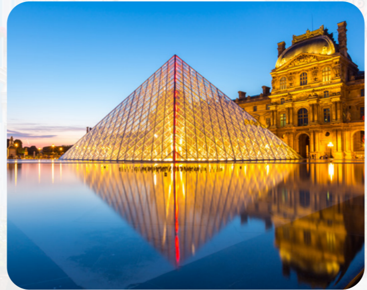
Der Louvre in Paris ist das größte Kunstmuseum der Welt. Hier gibt es über 380.000 Kunstwerke.

Danke, dass du auf unserer Reise durch Frankreich dabei warst!