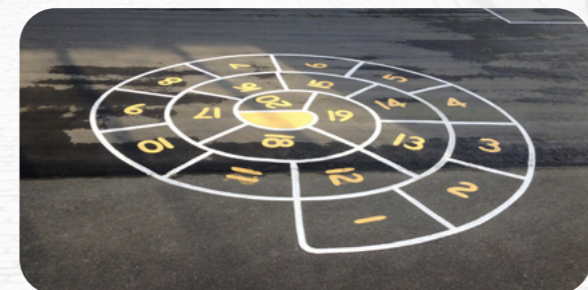
In Frankreich spielen die Kinder ein Spiel namens „Escargot“ (Schnecke). Dabei muss man in einem schneckenförmigen Muster bis zur letzten Markierung hüpfen.

Kommst du aus Frankreich? Schreib uns! Wir würden uns sehr darüber freuen.