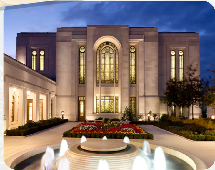
In Frankreich leben fast 40.000 Mitglieder der Kirche. Im Mai 2017 wurde der Tempel in Paris fertiggestellt.