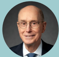
Av president Henry B. Eyring Annenrådgiver i Det første presidentskap