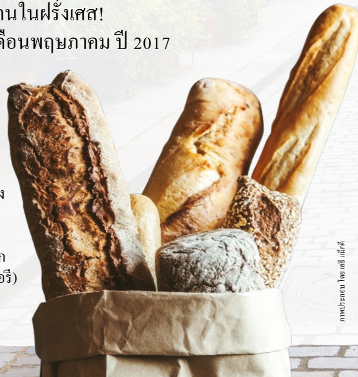
ภาพประกอบ โดย คดี แม็คคีย์

ฝรั่งเศสมีชื่อเสียงเรื่อง ขนมปังกับเนยแข็ง คนจำนวนมากซื้อ บาเกตขนมปังสดจาก boulangeries (ร้านเบเกอรี่) ทุกวัน