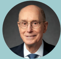
Saunia e Peresitene Henry B. Eyring Fesoasoani Lua i le Au Peresitene Sili