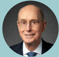
Ni Pangulong Henry B. Eyring Pangalawang Tagapayo sa Unang Panguluhan