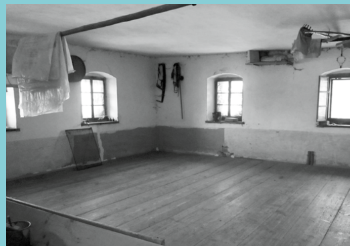
De første siste dagers hellige gudstjenestene i Østerrike ble holdt i Hubers kornkammer som er avbildet her.