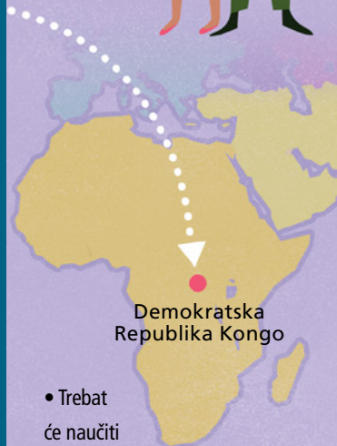
Demokratska Republika Kongo