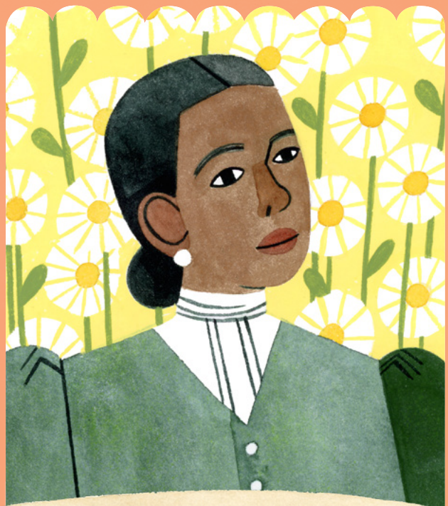
JANE MANNING JAMES