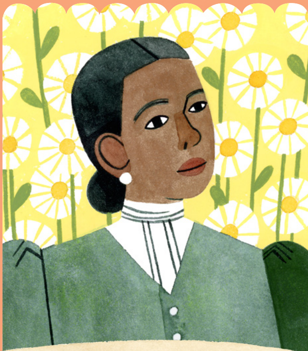
JANE MANNING JAMESOVÁ