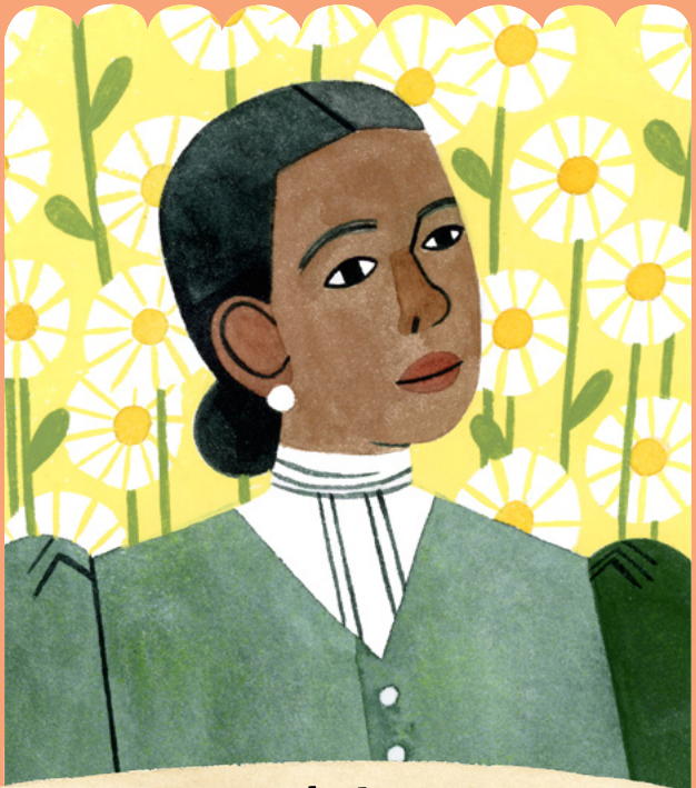
JANE MANNING JAMES