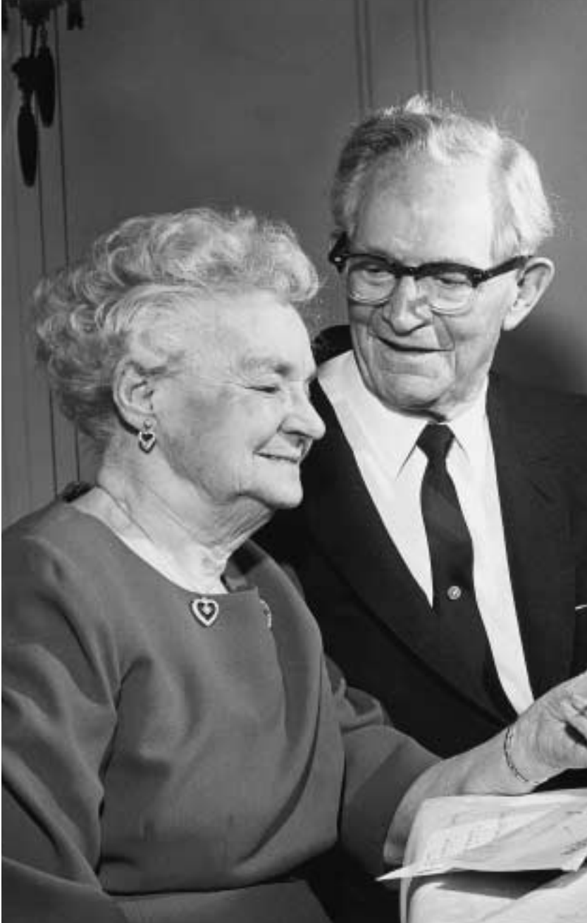
맥케이 대관장과 맥케이 자매는 인생의 문제들이 일어날 때마다 남편과 아내의 감미로운 관계가 점점 더 사랑스러워져 가는 것을 느꼈다.