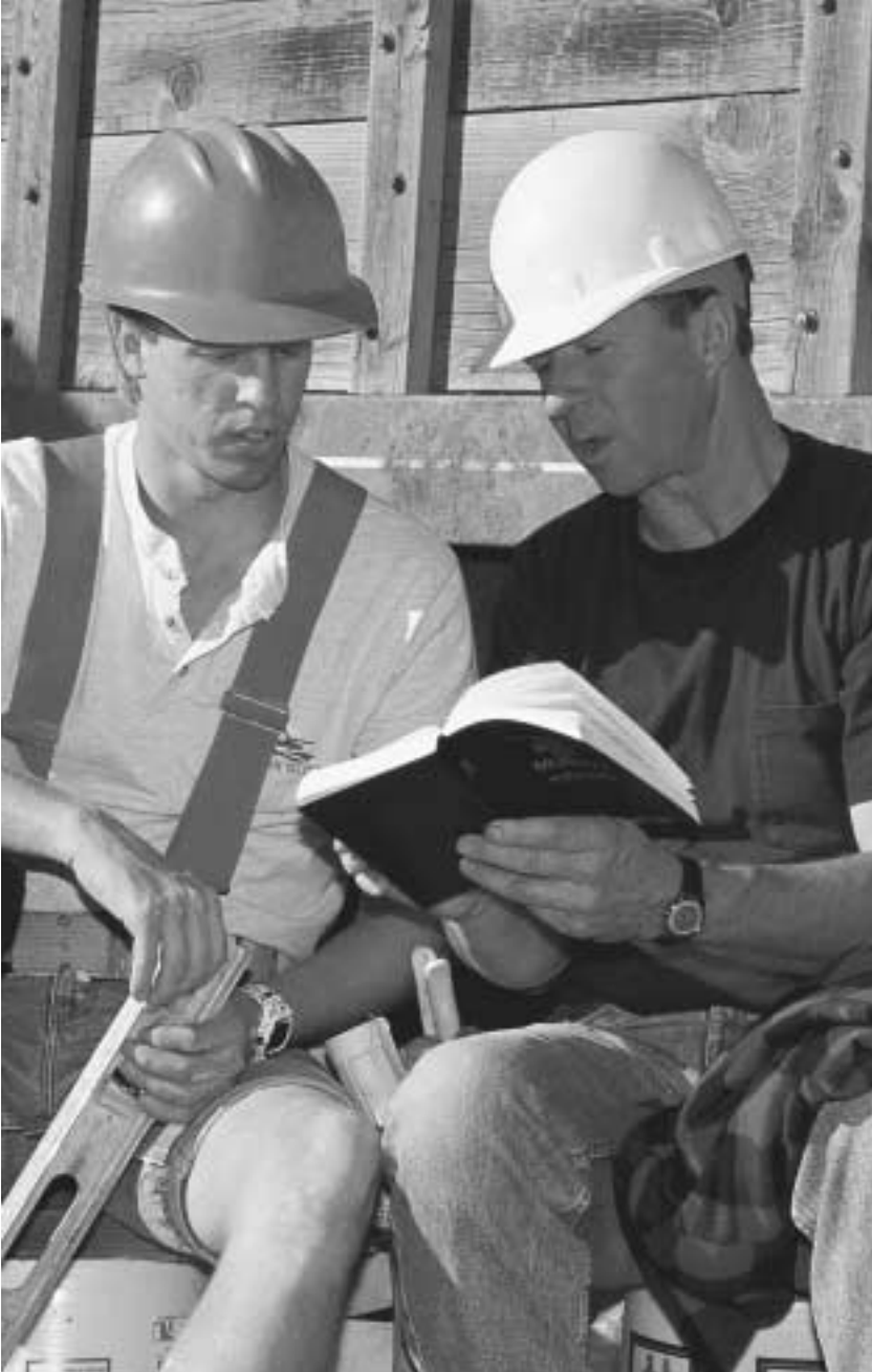
복음을 나누어야 하는 책임은 각 교회 회원에게 있습니다.