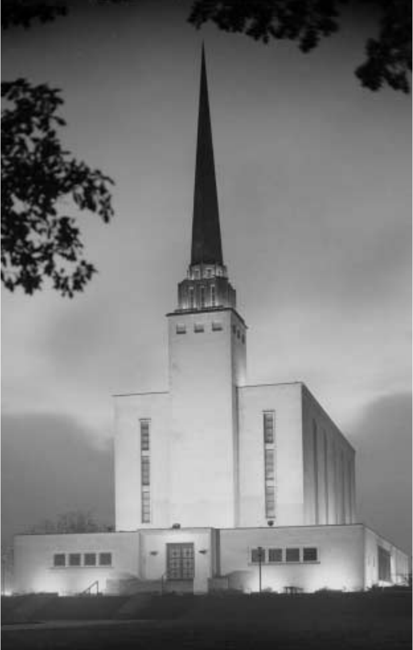
맥케이 대관장은 제임 기간 동안 영국 런던 성전을 포함하여 전세계에 다섯 개의 성전을 헌납했다.