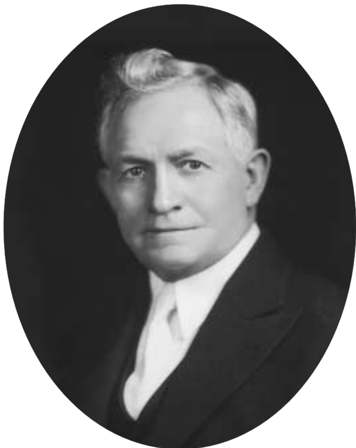
David O. McKay

데이비드 오 맥케이는 1906년에 사도로 성임되었으며, 1951년에 대관장으로 지지되었다.