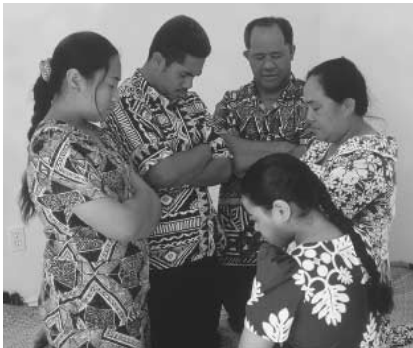
“여러분은 아버지께 기도를 드리고, 자녀들에게 기도할 것을 가르치라는 그리스도의 권고를 따르십니까?”