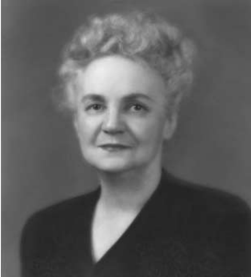
맥케이 대관장과 그의 아내 엠마 레이 릭스 맥케이(위)의 관계는 교회 회원들이 따라야 할 표본이 되었다.

신하시나요?” 라고 물었다. 그는 확신한다고 말했다. 24 1901년 1월 2일에 엠마 레이 릭스와 데이비드 오 맥케이는 솔트레이크 성전에서 결혼한 20세기 최초의 부부가 되었다.