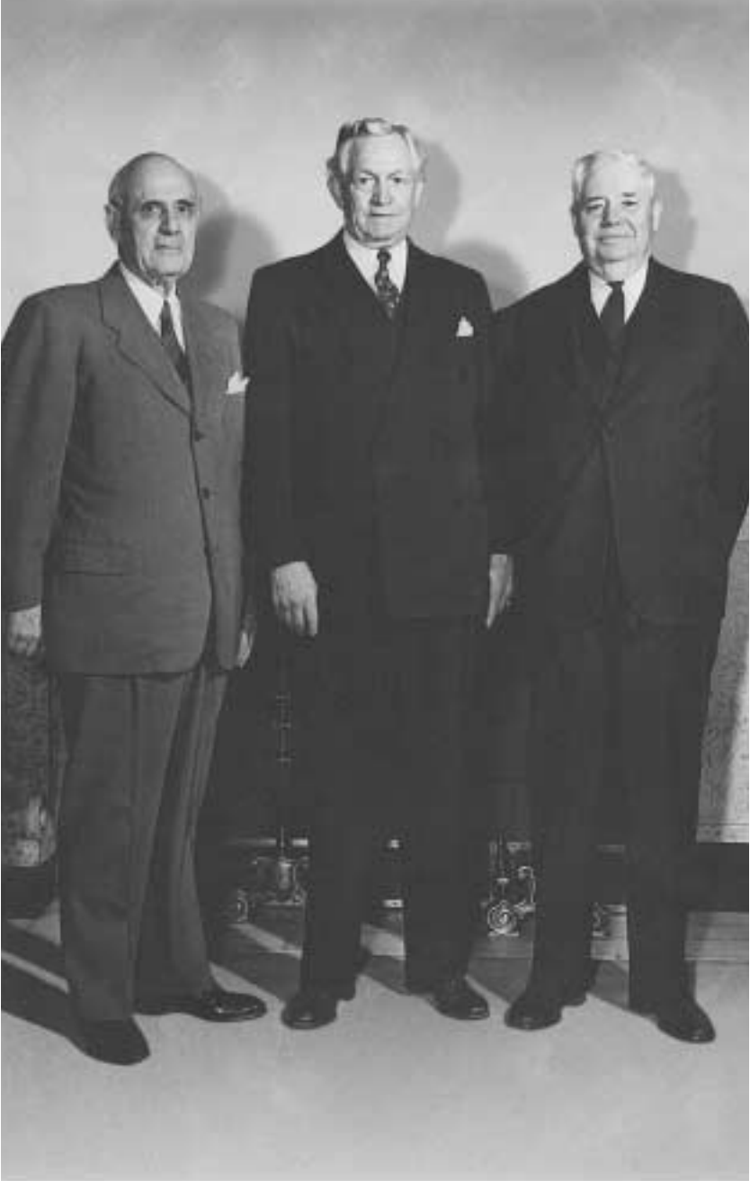
맥케이 대관장과 그의 보좌들, 스티븐 엘 리차즈 부대관장(왼쪽)과 제이 르우벤 클라크 이세 부대관장(오른쪽). 맥케이 대관장은 교회 회원들이 대관장단의 단합을 보았기를 바란다고 했다.