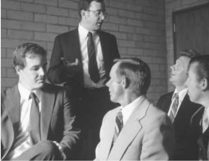
신권의 특정한 직분에서 봉사하도록 지명된 사람들은 정원회에서 하나가 됩니다.

회를 강화할 의무가 있습니다. [신권회]에 참석하지 않음으로써, 혹은 준비하지 않음으로써, 혹은 의무를 게을리 함으로써 정원회를 무너뜨리는 일이 없게 합시다. 우리 모두 … 교회의 의무가 진리를 세우고 인류를 죄로부터 구속하는 것인 만큼, 교회를 건설하기 위해 무엇인가를 하는 것이 우리의 의무라는 것을 느끼도록 합시다. 신권을 소유한 형제 여러분, 이러한 건설 사업에서 하나가 됩시다. 선을 행하는 사람이 됩시다. 그리고 대제사에서부터 집사에 이르기까지 이 위대한 신권 활동에서 아무도 악을 행하거나 불평하지 않도록 합시다. 10