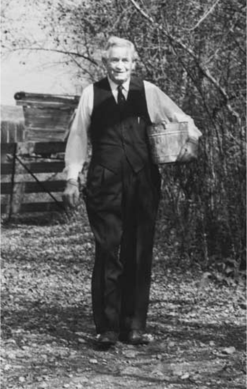
맥케이 대관장은 가르침과 모범을 통해, 지혜의 말씀에 따라 생활하는 축복을 보여 주었다.