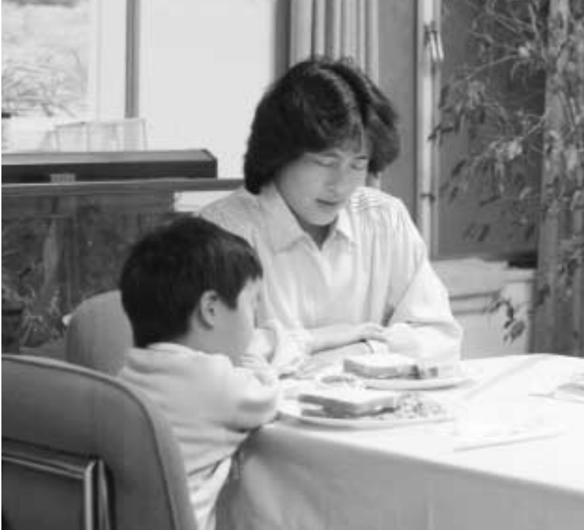
맥케이 대관장은 말일성도들에게 “모범과 교훈으로” 자녀와 다른 사람들에게 지혜의 말씀을 가르치도록 권고했다.

것이 반드시 쉬운 것은 아닙니다. 오늘날의 젊은이들은 거짓된 사상과 부도덕한 관습이라는 적에 직면해 있습니다. ... 이러한 적에 대항하고 정복하기 위해서는 확고한 준비가 필요합니다. 12