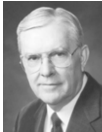
Старейшина М. Рассел Баллард

Я знаю, что Бог жив и Иисус есть Христос. Я знаю, что мы можем выполнять свою работу лучше через единство и любовь, царящие среди нас, когда мы советуемся друг с другом. О том, чтобы мы были благословлены поступать именно так, я смиренно молюсь во имя Иисуса Христа, аминь.