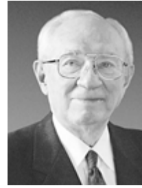
Старейшина Гордон Б. Хинкли