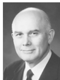
Старейшина Даллин Х. Оукс