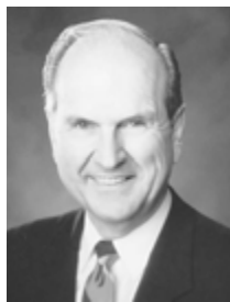
Старейшина Рассел М. Нельсон