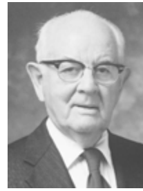
Президент Спенсер В. Кимбалл