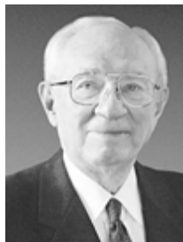
Президент Гордон Б. Хинкли