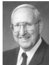
Старейшина Вон Дж. Фезерстоун

Член Кворума Семидесяти Отрывки из The Incomparable Christ: Our Master and Model (1995), 106–108, 110–111, 113–116, 119–120, 123–125, 128–132.