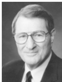
Нил А. Максвелл

Впоследствии призван в Кворум Двенадцати Апостолов