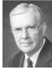
Старейшина М. Рассел Баллард

Интересно, смог ли Тот, Кого мы называем Учителем Неба и Земли, каким-либо образом передать в сердце вдовы Свою нежную, сердечную благодарность за ее дар?