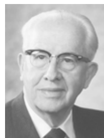
Президент Эзра Тафт Бенсон