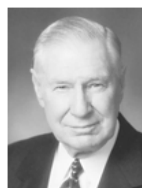
Старейшина Джеймс И. Фауст