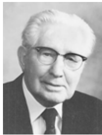
Старейшина Хью Б. Браун