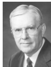
Старейшина М. Рассел Баллард