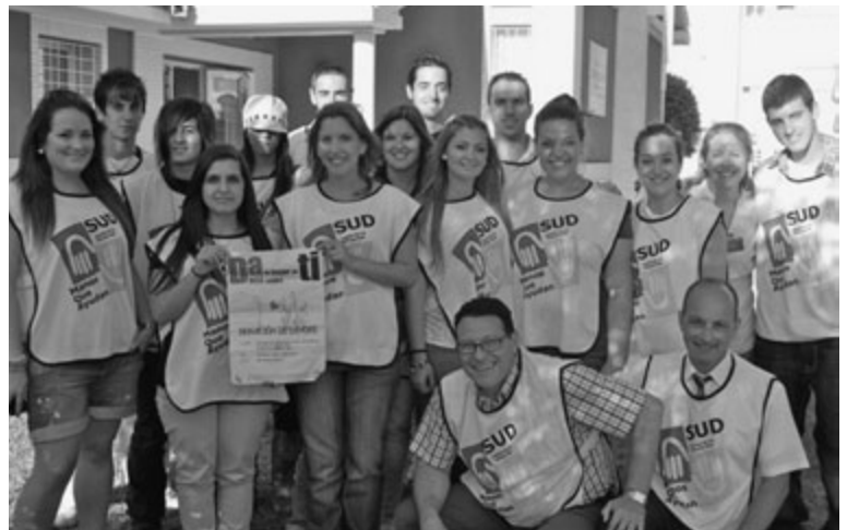
Los jóvenes que participaron en esta jornada de servicio con el presidente López y los misioneros de instituto.

Unidades de la Iglesia que participaron: 6 barrios y ramas.