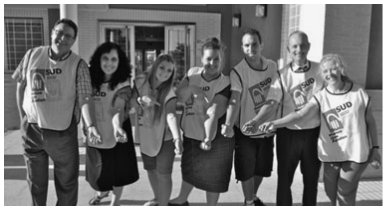
Felices por haber donado.

A lo anterior se unen las donaciones efectuadas entre enero y mayo en San Fernando y Chiclana, unas 600 en total. ■