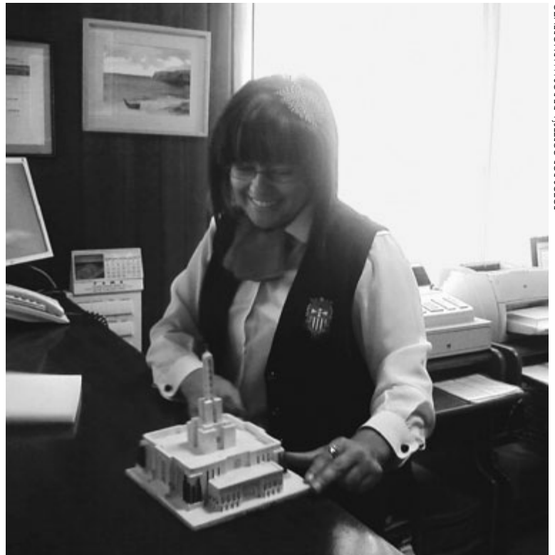
En el momento de la entrega de la maqueta del Templo de Madrid.

Agradezco el cariño y el esfuerzo en equipo que todos realizaron, ayudando a quien lo necesitó y demostrando la virtud del servicio. ■