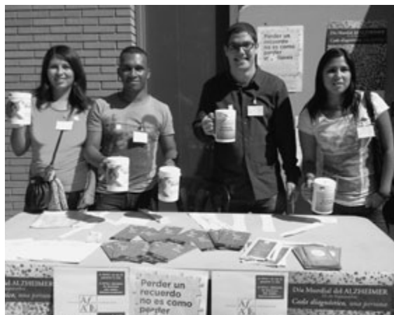
Los jóvenes de Lleida recaudan fondos para la Asociación del Alzheimer.

Todos coincidían al describir esta experiencia: “Nos sentimos muy agradecidos de haber podido ayudar con nuestro tiempo a recaudar fondos para los enfermos de Alzheimer. Hemos podido ver la caridad de muchas personas, y sentir el amor de muchas otras que tienen familiares en esta situación”. ■