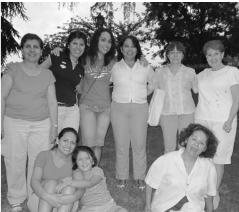
Un grupo de hermanas de la Sociedad de Socorro del Barrio 2 de Madrid.

Tras esta visita, subimos a la sexta planta, donde