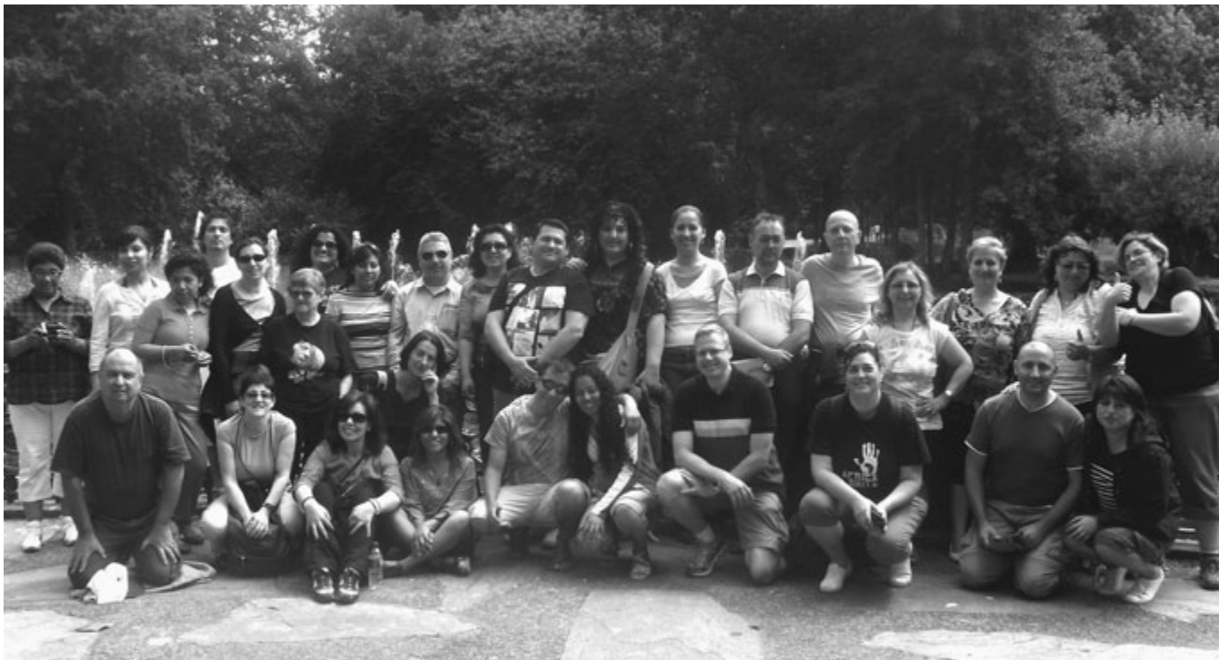
Durante una de las actividades en la playa.