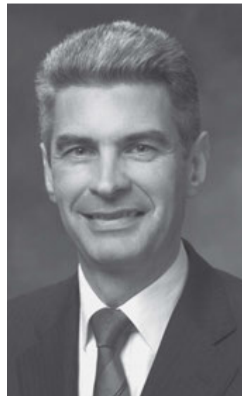
El élder Gérald Caussé

Esta segunda cosecha es, y será, más amplia que la primera. Europa se ha convertido en una intersección y un punto de encuentro para los pueblos del mundo entero. Basta con caminar por las calles de nuestras ciudades más grandes para comprobarlo.