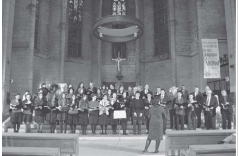
El coro Sons de l'Estaca, de la Estaca de Hospitalet, durante su actuación en la Basílica de Vilafranca.

Desde que se propuso el concierto hasta que