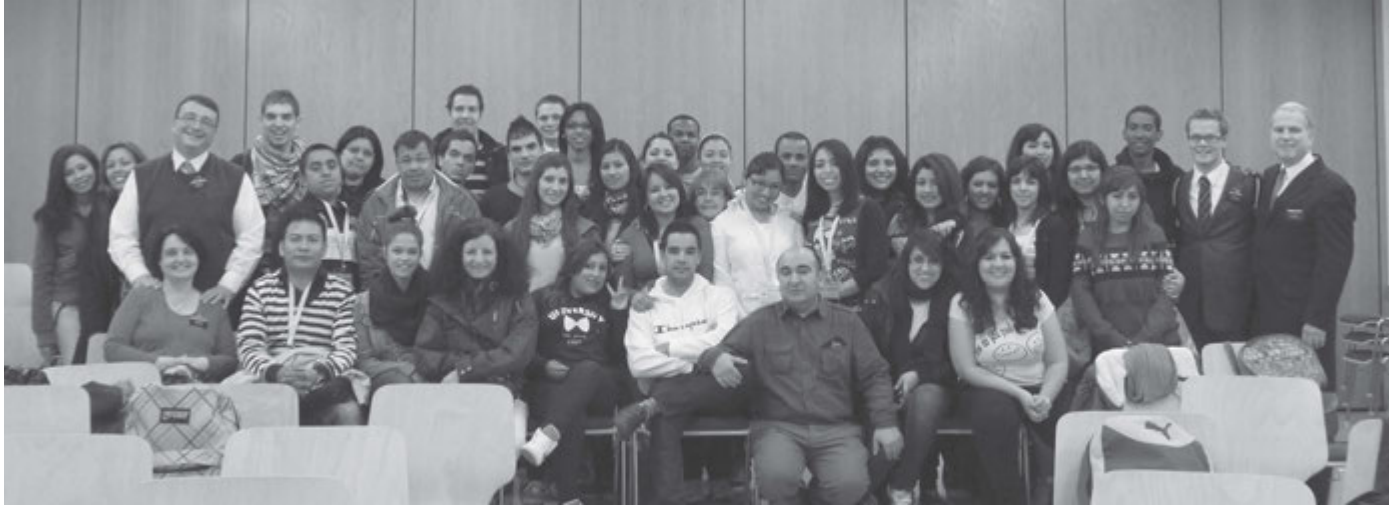
En la charla del presidente Watkins.