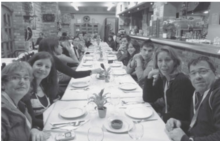
Los Jóvenes Adultos Solteros durante la cena en el restaurante mexicano.