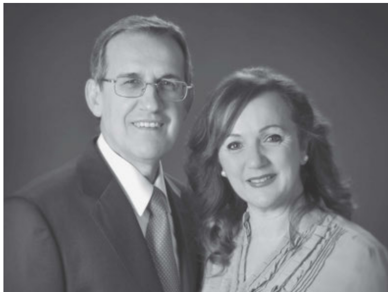
El presidente y la hermana Parreño.

La hermana Parreño ha servido como maestra