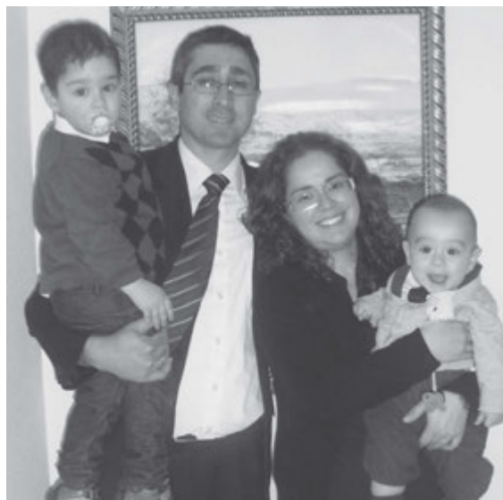
El primer presidente de la Rama de Huércal-Overa y su familia.