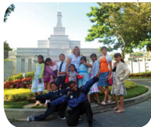
Los niños y jóvenes de la Rama Los Ángeles felices de estar en el templo junto a su presidenta de la Primaria y su presidente de rama.

en sus corazones, al escuchar los testimonios de sus padres luego de realizar convenios sagrados y adorar a Nuestro Padre Celestial. Estamos muy agradecidos y esperamos volver pronto. ■