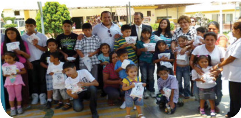
Gratitud – Los familiares de los niños beneficiados mostraron agradecimiento a la Iglesia.