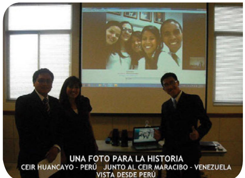
UNA FOTO PARA LA HISTORIA CEIR HUANCAYO - PERÚ JUNTO AL CEIR MARACIBO - VENEZUELA VISTA DESDE PERÚ