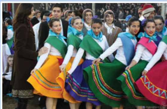
Fotos superiores de izquierda a derecha: -2200 hombres y mujeres jóvenes bailaron en la cancha y en los dos escenarios