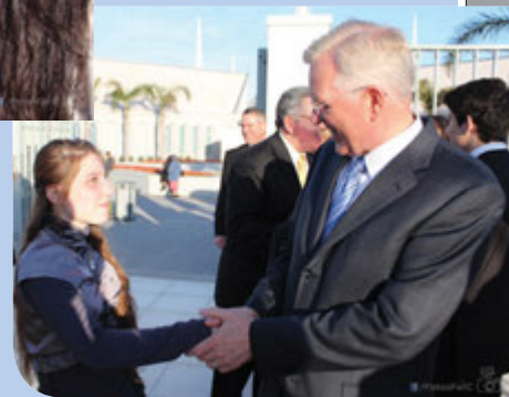
Elderes M. Russell Ballard y D. Todd Christofferson saludan luego de una de las sesiones de re-dedicación.

Tenemos nuevamente el templo entre nosotros. Ahora es el momento de agradecer las bendiciones, siendo instrumentos para bendecir la vida de quienes no conocieron el evangelio en la tierra. Hoy será siempre el momento de recordar nuestros convenios al ayudar a otras familias en el camino hacia la vida eterna. ■