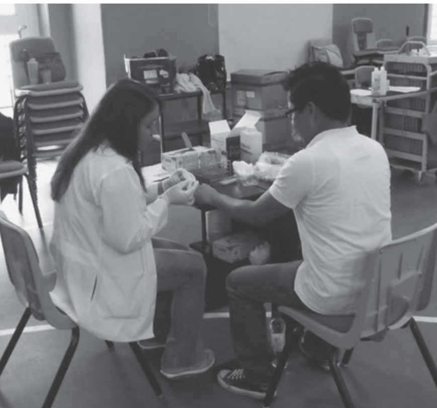
ASUNTOS PÚBLICOS DEL ÁREA

Se espera que se establezca una cultura de donar sangre en Guatemala. Entre los países de Centroamérica, Guatemala dona mucho menos que los otros países. Los beneficios de sangre donada son muchos, y el proceso no es dañino y poco inconveniente. Si las personas de 18 años a 55 años muestran un buen ejemplo a sus hijos o nietos, ellos estarán más dispuestos a continuar la tradición y así mejorar la calidad de vida para toda la comunidad. En verdad es un servicio a la humanidad. ■