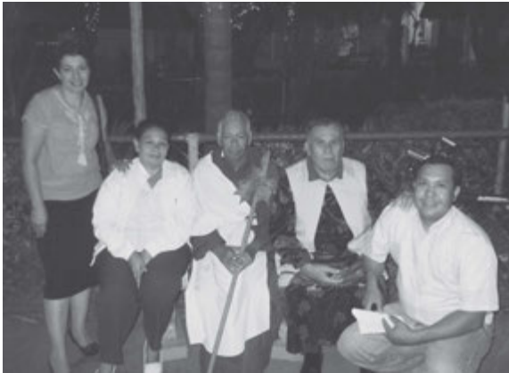
Algunos de los miembros de Matagalpa que colaboraron en la actividad misional.