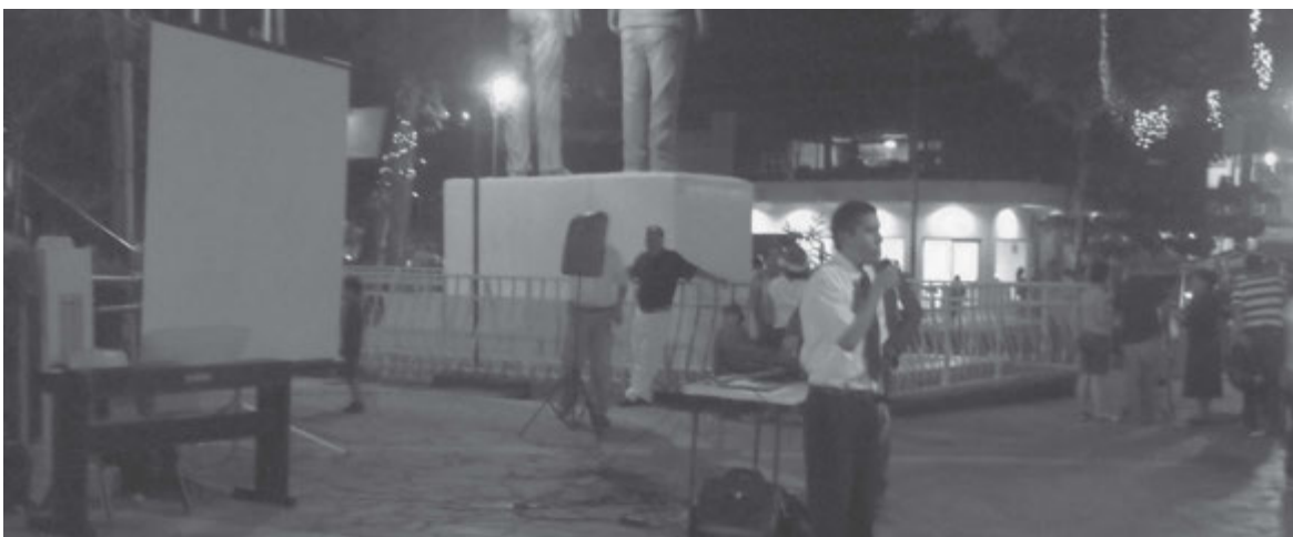
Los misioneros proyectaron videos de la Iglesia en el parque de la ciudad con mensajes de los profetas.