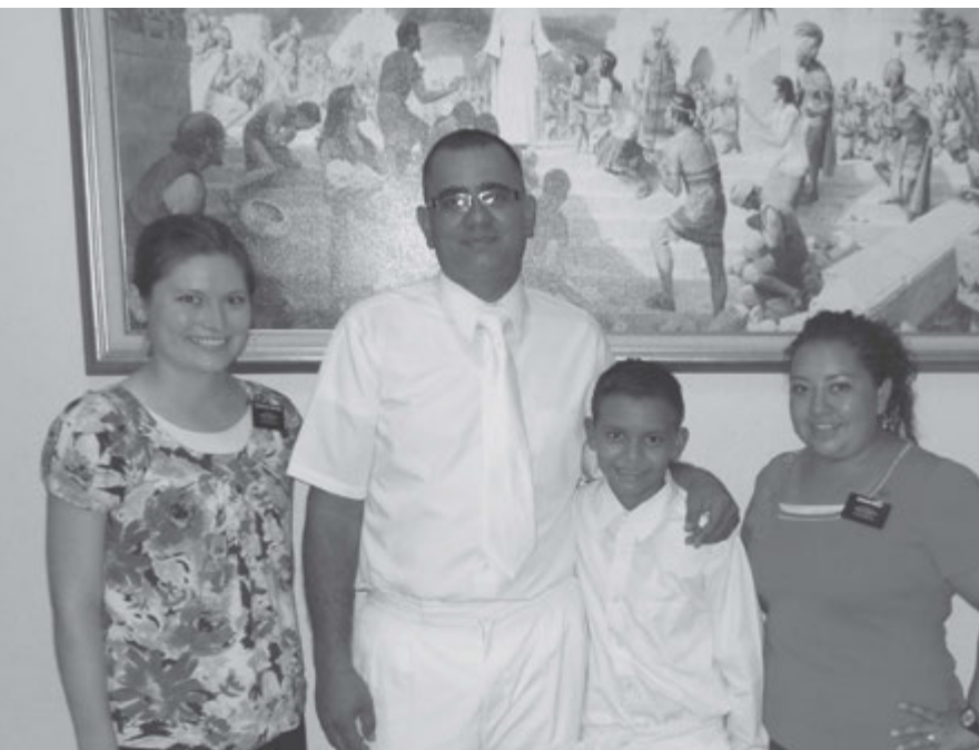
A la derecha, la hermana Corzo, Misión Nicaragua Managua Sur, en un servicio bautismal.

Sin falta, el siguiente domingo mi amigo me llevó a la Iglesia y cuando entré en el salón de reuniones, todos se acercaron a saludarme. Al comenzar las reuniones me dieron la bienvenida desde el púlpito, y me sentí como en casa. Después que disfruté de las reuniones, los misioneros me invitaron a una clase donde comenzaron a enseñarme la doctrina. Yo no vivía en el área del barrio, así que recibía las clases en la capilla cada domingo. Poco a poco, mi espíritu se fue saciando de esa hambre espiritual que yo tenía. Encontré lo que por mucho tiempo había estado buscando.