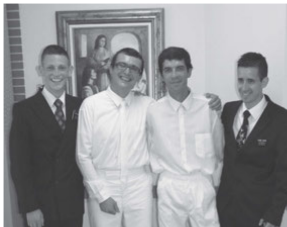
En cada servicio bautismal se vio la mano de Dios reflejada en los fieles miembros de la Iglesia.