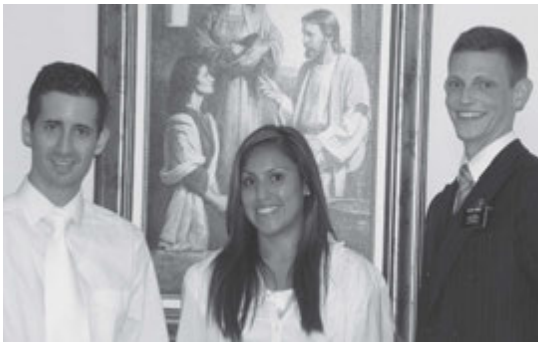
El trabajo conjunto de miembros y misioneros es el que mayor éxito produce en la conversión y retención de nuevos miembros.

El trabajo de todos los miembros junto con los misioneros ha dado su buen fruto. El campo está listo para la siega y esperamos, junto con la guía del Señor, continuar cosechando. Gracias a la labor de todos podemos engrandecer esta maravillosa obra del Señor. ■