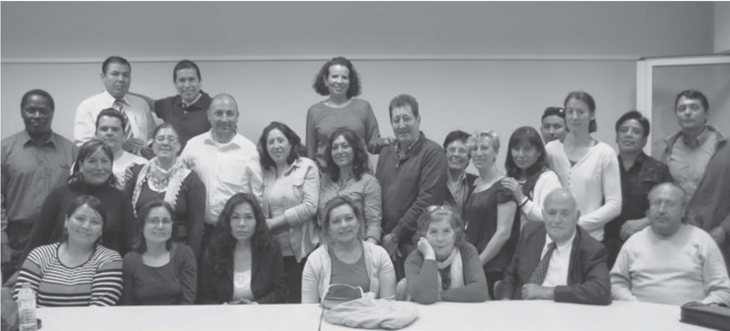
Algunas de las personas que acudieron a esta actividad de homenaje y despedida.