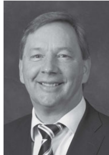
El élder Detlef Adler

Doy testimonio de la veracidad de estas enseñanzas y del gozo vinculado a la obra de historia familiar, que nos permite dar la oportunidad a nuestros antepasados de recibir todas las bendiciones del Evangelio en la vida venidera que ellos no pudieron tener aquí. ■