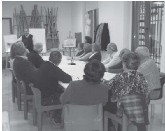
Asistentes al taller de historia familiar impartido en El Palmar.