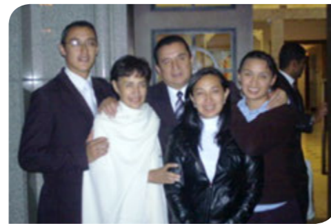
Sellados y juntos.- Como familia pudimos sellarnos en el Templo y ahora, aunque nuestra madre ya cruzó el velo, tenemos la esperanza de volver a vivir juntos por la eternidad.

Desde que recibí la noticia, oré mucho a mi Padre Celestial para que mamá me esperara y pudiera gozar de una familia eterna y una casa propia. Cuando terminé mi misión, me enteré que ya no vivíamos en la misma casa, que mis