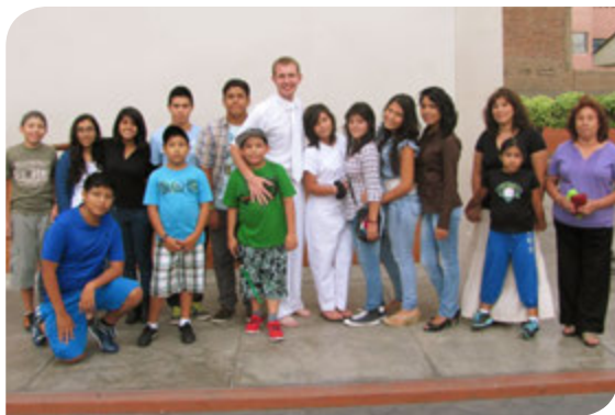
Amigos y hermanos.- Luego del bautismo, los jóvenes del Barrio Precursores dieron la bienvenida a la nueva conversa, hermana y amiga.

La fe en mi Salvador ha crecido enormemente y con todo mi ser puedo hoy decir que mis conversos son mi gloria y gozo y sé que lo serán para todos los que tengan el deseo de servir en esta la más grande y noble causa que puede haber, la Obra Misional.