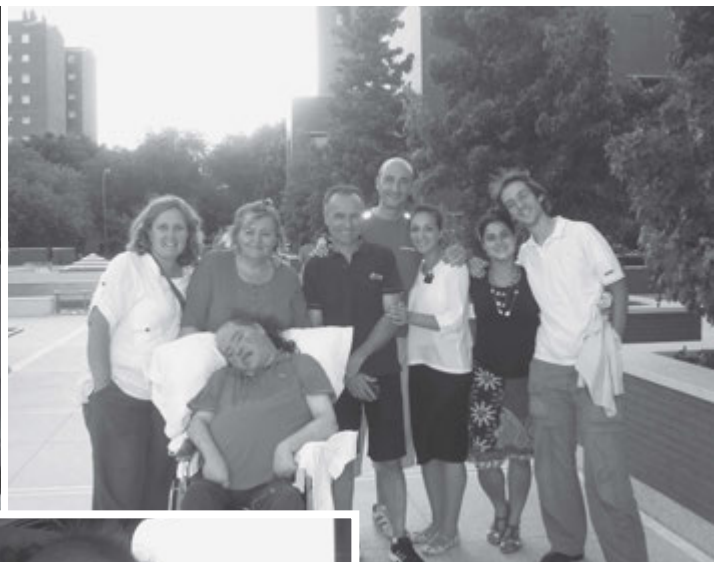
El grupo, en los jardines del templo.