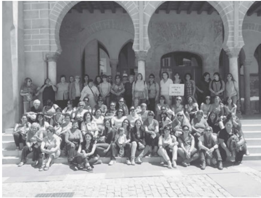
Las hermanas de la Sociedad de Socorro de Sevilla se reunieron en una actividad de hermanamiento en la bella ciudad de Badajoz.