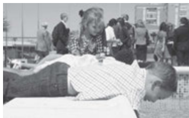
Niños de la Primaria y futuros líderes de la Iglesia en las Islas.