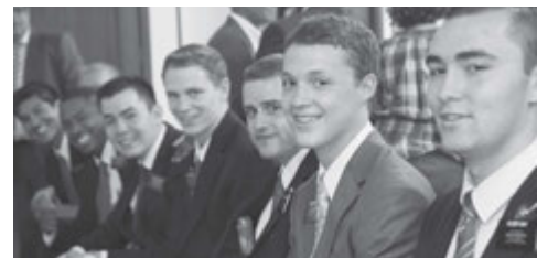
Misioneros sirviendo en las Islas Canarias.