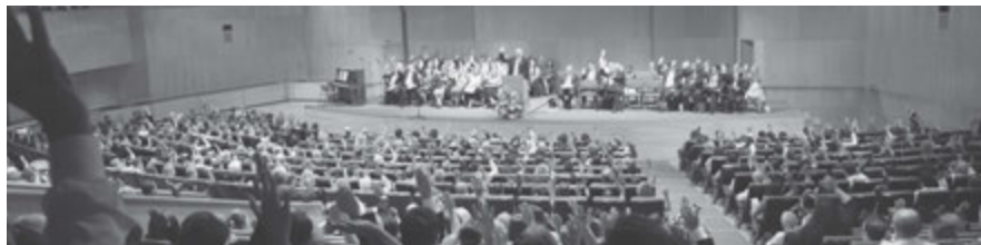
Sostenimiento de los líderes en la sesión del domingo.