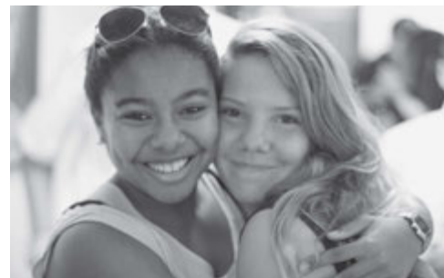
Los jóvenes canarios se unen al entusiasmo de los demás miembros en estos momentos especiales e históricos para la Iglesia en su tierra.