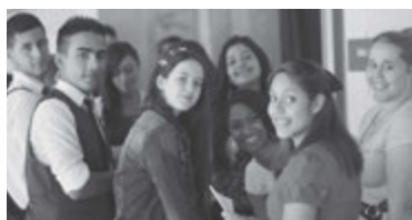
Algunos de los jóvenes preparando los programas de la conferencia de estaca.