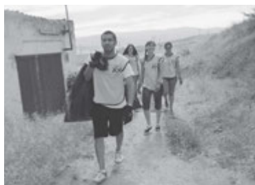
El programa MMQA refleja el deseo que los mormones tienen de seguir el ejemplo de Jesucristo por medio del servicio a los demás.

Algunas de las reseñas que aparecieron el pasado verano en los medios de comunicación se pueden leer desde la versión online de este artículo, en LDS.org , preview.lds.org/church/news/cientos-de-jovenes-mormones-limpian-jardines-y-donan-sangre-en-segovia?lang=spa&country=es ■