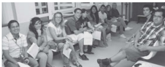
Dentro del programa de la conferencia se ofrecía a los jóvenes la posibilidad de donar sangre.

Un grupo de jóvenes esperando su turno para donar sangre.