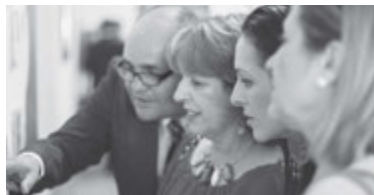
La nueva estaca tiene más de 3.500 miembros.

Las Islas Canarias son un eslabón más en el cumplimiento de las promesas hechas por el profeta Isaías: "Ensancha el sitio de tu tienda... alarga tus cuerdas y fortalece tus estacas".