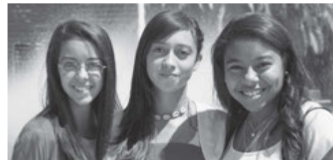
Mujeres Jóvenes a la entrada del centro de reuniones, momentos antes de la conferencia.

Las Islas Canarias son un eslabón más en el cumplimiento de las promesas hechas por el profeta Isaías: "Ensancha el sitio de tu tienda... alarga tus cuerdas y fortalece tus estacas".