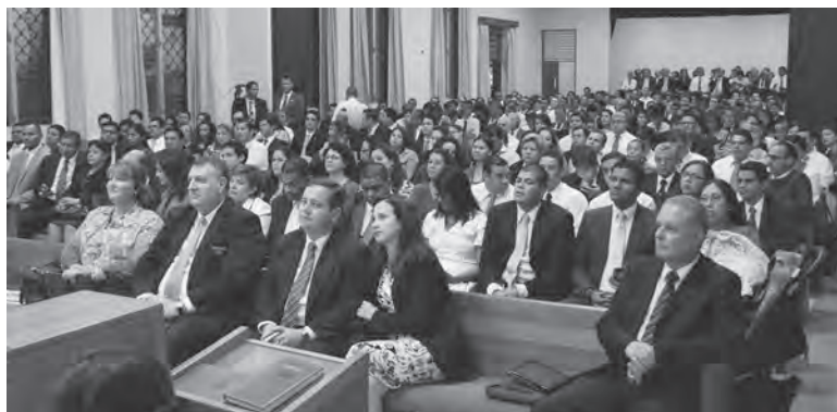
Líderes que participaron en la charla con el élder Cook en Costa Rica.