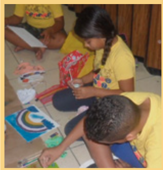
Entre distintas actividades, los jóvenes recibieron clases de pintura.

MI historia de inicio en la Iglesia es algo diferente a las que seguramente has escuchado. Mis papás y mis hermanos se unieron a la Iglesia en 2004 y yo me convertí en la rebelde de la casa por no querer seguir sus pasos. Pasado algún tiempo, como a cualquier miembro, a mi mamá se le dio un llamamiento. La llamaron como presidenta de la Primaria del barrio. De ahí empecé a ayudarla a preparar sus clases y, si mi memoria no falla, hasta la ayudé con la decoración para una presentación anual de la Primaria.