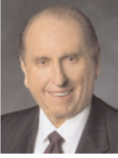
Başkan Thomas S. Monson